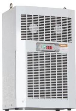
1. 電氣箱冷卻機 Air conditioner