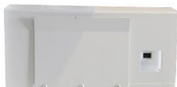
2. QR-CODE自動 判讀功能