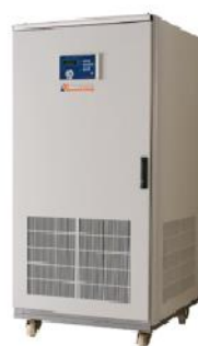
4. 變壓器 電源 Transformer