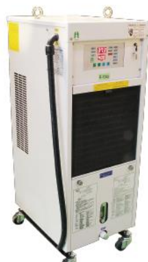
3. 主軸冷卻裝置 Spindle cooling system